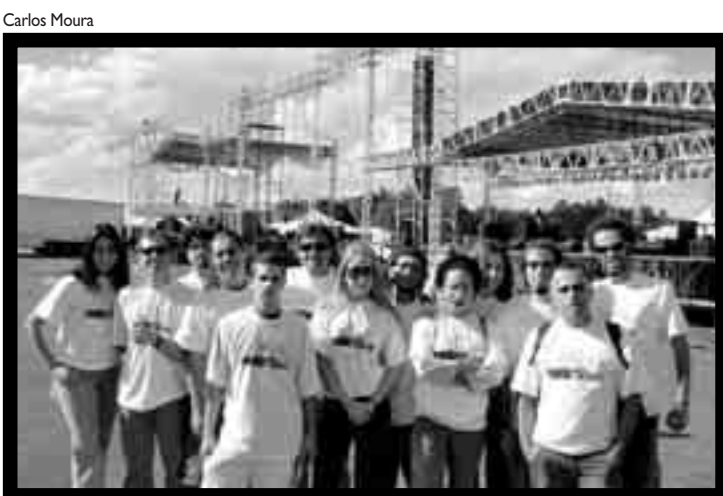
ANJOS DO PORÃO: RESPONSÁVEIS POR RECEBER DOAÇÕES E AJUDAR ROQUEIROS

sou por um treinamento, feito pelos psicólogos da ONG Transforme. Além disso, os voluntários podem ajudar quem estiver perdido a se localizar dentro da arena.